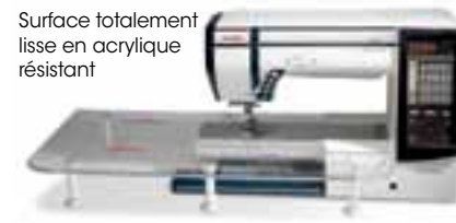
Surface totalement lisse en acrylique résistant