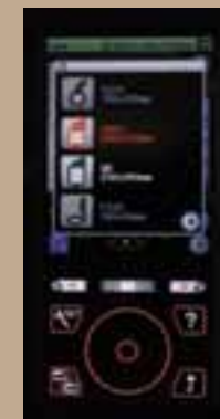
Choix Du Cerceau