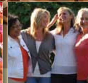
Les « JanomeGals » de SewingGood.com

La chambre de bébé ci-dessus a été créée par les « JanomeGals » du site SewingGood.com en utilisant la MC12000 dans le cadre d'un projet caritatif en aide à une famille dans le besoin. Janome souhaite remercier Free Spirit Fabrics d'avoir donné l'ensemble du tissu Anna Maria HornerLoulouthi, et MinkyDelight.com pour avoir donné toutes les couvertures douces.