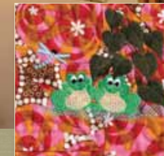
Détail de broderie du dessus de lit pour bébé de SewingGood

Malgré toutes ses fonctions perfectionnées de broderie et de matelassage, la Memory Craft 12000 reste avant tout une incroyable machine à coudre. De la complexité des passepoils et des nervures à la simplicité des coutures au kilomètre, la puissance, la précision et le choix de points de cette machine rendront tous vos projets de couture plus simples et plus agréables. Janome est renommée pour la qualité et la fiabilité de ses produits et pour la fabrication de machines exemptes de tout problème permettant de laisser libre cours à votre créativité.