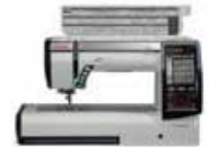
Nombreux rangements sous le couvercle et dans la base, et tableau des points au niveau des yeux

❖ Dimensions avec l'unité de broderie : Larg. 22,6 po x haut. 12,4 po x prof. 13,6 po (Larg. 575 x haut. 316 x prof. 346 mm)