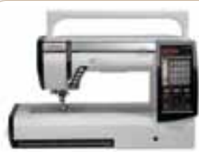
Assez légère pour être portée avec la poignée rabattable