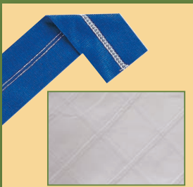
Point de recouvrement étroit gauche (3mm) ou droit (3mm) 2 aiguilles - 3 fils