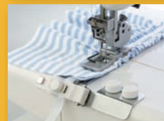
Fronceurs élastiques - 6/8,5 mm - 9/13,5 mm