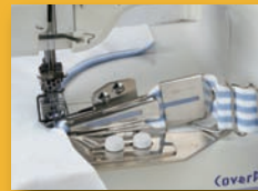
Guides pose biais - 32/8mm - 42/12 mm