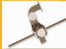
Guide de couture réglable