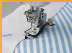
Semelle avec guide de couture centrée