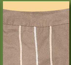
Point décoratif avec des fils fantaisie dans le boucleur