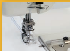
Semelle transparente pour ourlet couvert