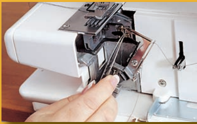
Système d'enfilage simplifié Débrayage du boucleur & Codes couleurs