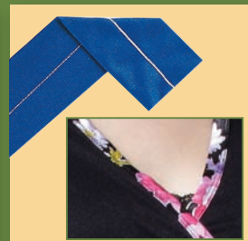
Point de chaînette 1 aiguille - 2 fils 3 positions d'aiguille possibles