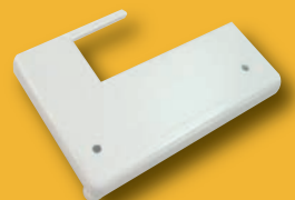
Table de couture - avec indications inch/cm - surface de 295x205 mm