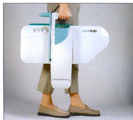
Facilité de transport, facilité de rangement