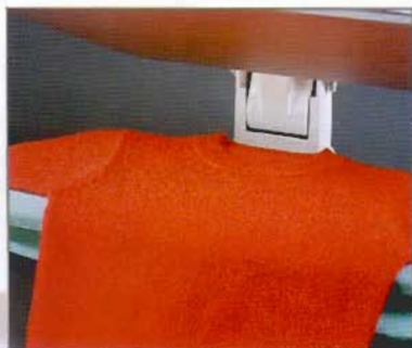
Repasser facilement les jersey délicats