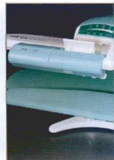
Attention au détail