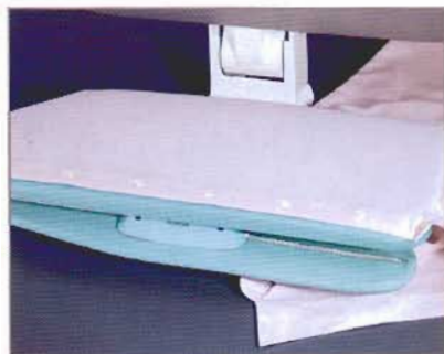
Repasser une chemise en moins d'une minute