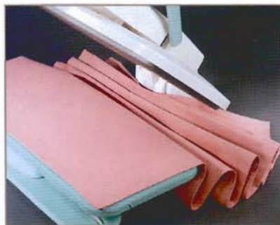
Repasser aisément plusieurs couches de tissus