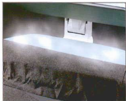
Utiliser la vapeur pour effectuer un pli professionnel