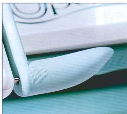
Verrou de sécurité pour le transport