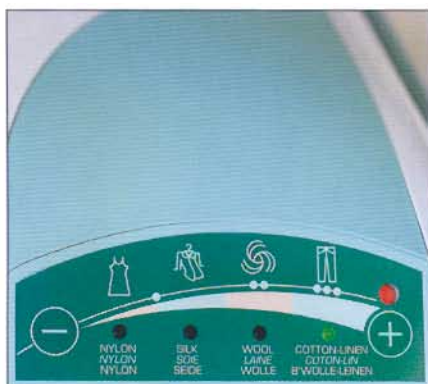
Lisibilité des indicateurs électroniques