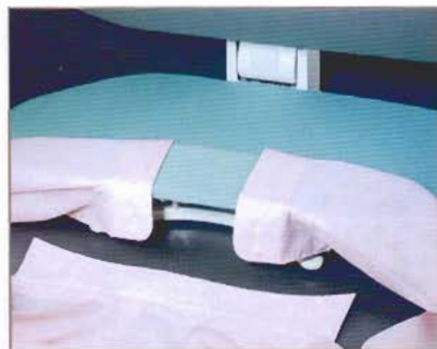
Poser les poignets de chemise sur la jeannette