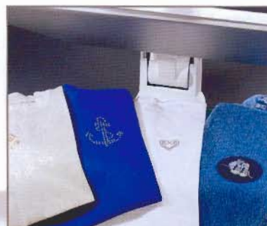
Poser de jolies perles ou des transferts décoratifs

Elnapress Opal est également équipée d'accessoires particuliers tels que le Vap-O-Jet et la jeannette intégrée.