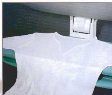
Pas de tissu déformé, pas de tissu froissé