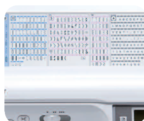
Tableau de référence des points pour visualiser rapidement les 294 fonctions de couture.