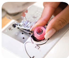
Il vous suffit de positionner une canette pleine et vous pouvez commencer à coudre immédiatement.