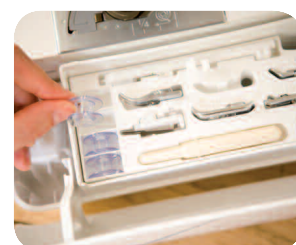
Compartiment à accessoires spécialement conçu pour ranger tous les accessoires livrés.

Choisissez parmi les 294 points utilitaires et décoratifs incluant 10 types de boutonniers et 3 alphabets