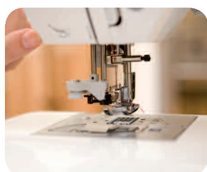
Système d'enfilage de l'aiguille automatique.