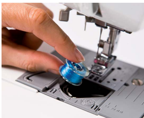
Mise en place rapide de la canette - placez tout simplement une canette pleine et vous pouvez commencer à coudre