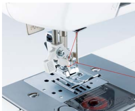
Enfilage facile et automatique de l'aiguille