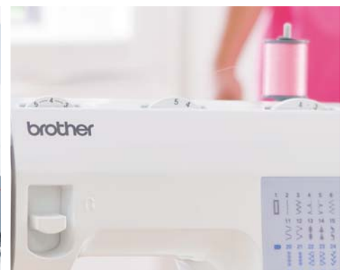
Longueur et largeur de point réglables

Pour plus d'informations, contactez votre spécialiste ou rendez-vous sur www.brothersewing.eu .