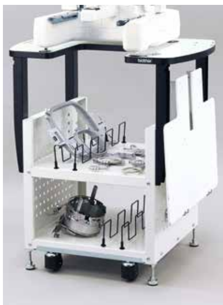
Table et rangement pour machines PR

Cette table mobile supporte solidement les machines de la gamme PR et offre un vaste espace de stockage et de rangement pour vos accessoires et vos fils.