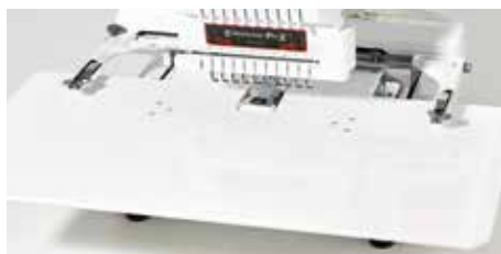
Table d'extension pour les très grands projets

L'accès simplifié à la canette vous fait gagner du temps. Vous pouvez changer la canette sans devoir retirer le cadre à broder.