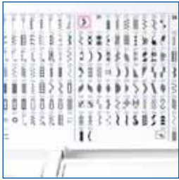
Tableau de référence des fonctions de couture

L'Innov-is 550SE est livrée avec un tableau de référence amovible, vous pourrez ainsi trouver immédiatement le numéro correspondant au point que vous souhaitez utiliser.